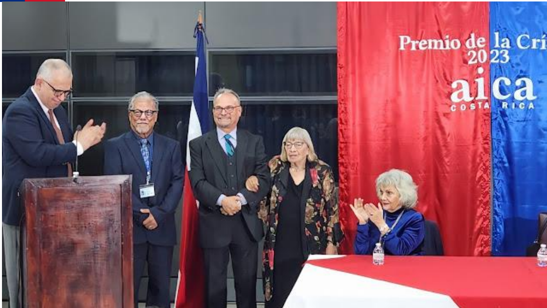
Presentación oficial del nuevo comité de premios y reconocimientos 2024.