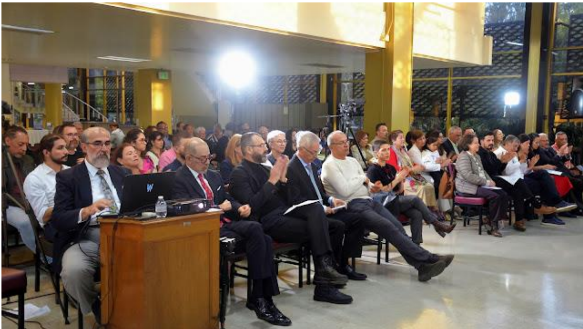
Vista general del auditorio de la premiación en la Biblioteca Nacional.

Mediante el Premio de la Crítica AICA Costa Rica se reconoce la labor de creadores, gestores, críticos de arte y curadores, así como de mecenas, publicaciones y eventos especiales realizados en torno a las artes visuales. Por el rigor que se manifiesta en la selección y premiación de los galardonados, es uno de los reconocimientos más importantes en las artes visuales.