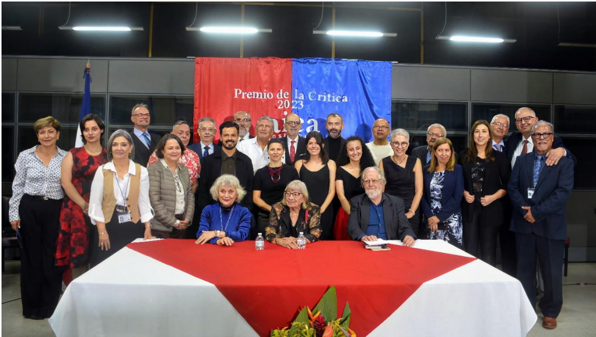
Galardonados y miembros de AICA Costa Rica en la clausura de la segunda edición.

El capítulo costarricense de la Asociación Internacional de Críticos de Arte (AICA) cumple así con uno de los significativos mandatos de AICA Internacional a sus filiales establecidas en 65 países de los cinco continentes que representan a más de seis mil miembros.